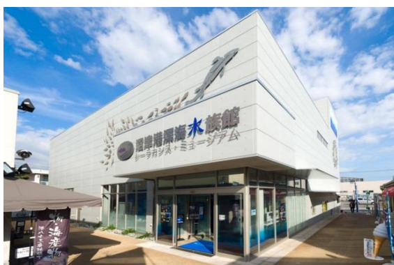
沼津港深海水族館外観