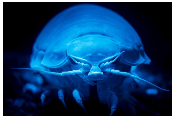
展示深海生物 ダイオウグソクムシ