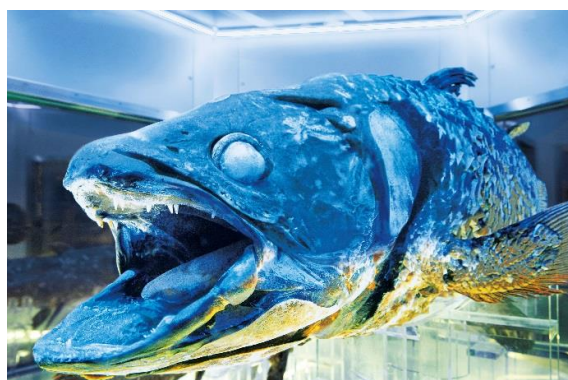
世界的に希少な冷凍シーラカンス