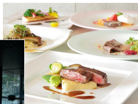
フレンチフルコースディナー「プレシャス」 ※イメージ