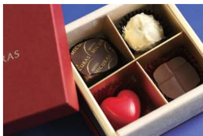
ミクラスオリジナルチョコボックス