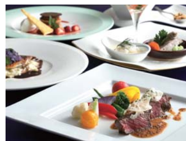
フレンチフルコースディナー(イメージ)