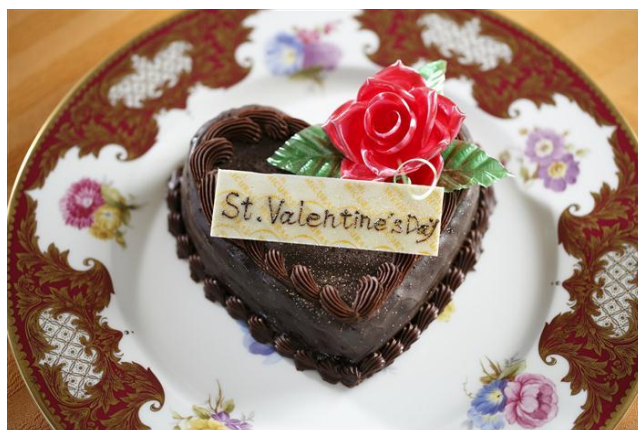
シェフパティシエ手作り☆「大人のバレンタインチョコレートケーキ」 販売価格:2,500円(税込み) サイズ:直径13cm(2人前)

※VALRHONA 社・・・1922年フランスで創業。世界のトップパティシエが愛用されると言われるチョコレートメーカー。