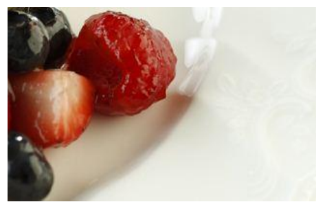
7種類の果物を使用した フルーツポンチ