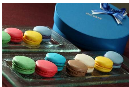
心理効果が期待できる 7色のマカロン