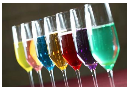
気分に合わせて選べる レインボーカクテル