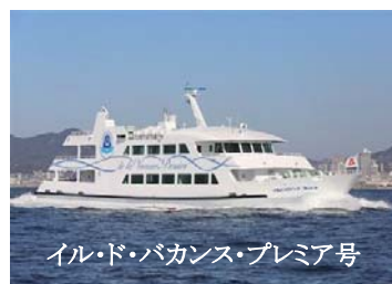
イル・ド・バカンス・プレミア号