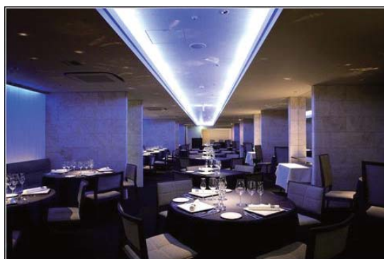
ミクラスダイニング