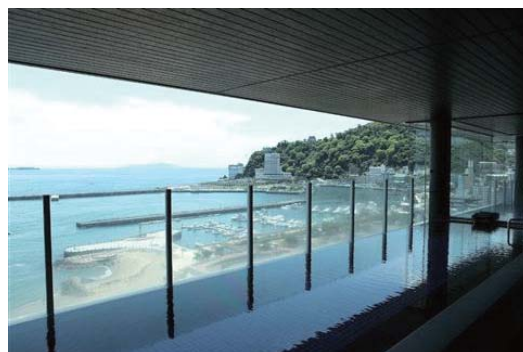
最上階大パノラマ展望風呂