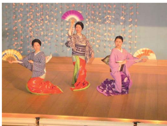
熱海芸妓の舞い ※イメージ